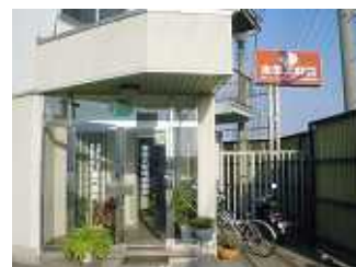
太平工材株式会社 本社 (兵庫県 姫路市)

太平工材株式会社様は、ステンレスとアルミニウムを主体とした素材及びその素材を使った全ての加工品の取り扱いを行われておられます会社様です。